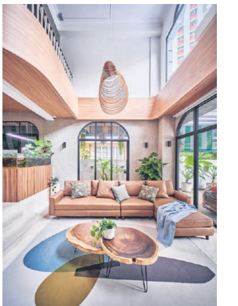
位于盛港的三层楼半独立式洋房。客厅以大自然为主题，设计焦点在客厅与饭厅间水陆造景鱼缸。木制旋转灯饰，有如贝壳，照亮两张树桐咖啡桌，衬托代表大自然色彩的深褐色沙发。(Free Space Intent提供)

残酷的事实是，往往舒服的沙发款式比较缺乏设计感，比如高背设计，视觉上较为厚重。选择太大太长的沙发，也可能占据客厅的大部分空间。