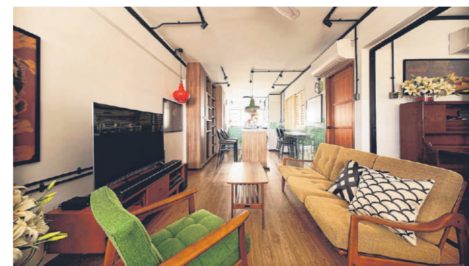
位于碧山的三房式组屋。客厅设计受王家卫电影《阿飞正传》启发，具有香港茶餐厅的韵味。八九十年代的家具风格，从旧时钟到旧吊灯，散发复古情怀。

灯光影响客厅的氛围，可运用不同的灯光颜色，转换客厅的气氛。例如，采用凹形灯 (cove light) 可变化出彩虹的不同颜色，能从七种颜色中选择符合当下心情的颜色。