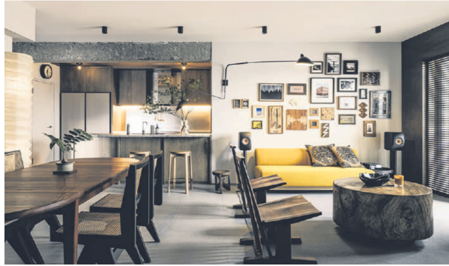
位于兀里 (Woodleigh) 的五房式组屋。客厅像展厅，设计师特地选了一盏有两个“手臂”的灯饰，一个可当阅读灯，另一个可照亮艺术品或天花板，让屋主有调整灯饰角度的灵活性。