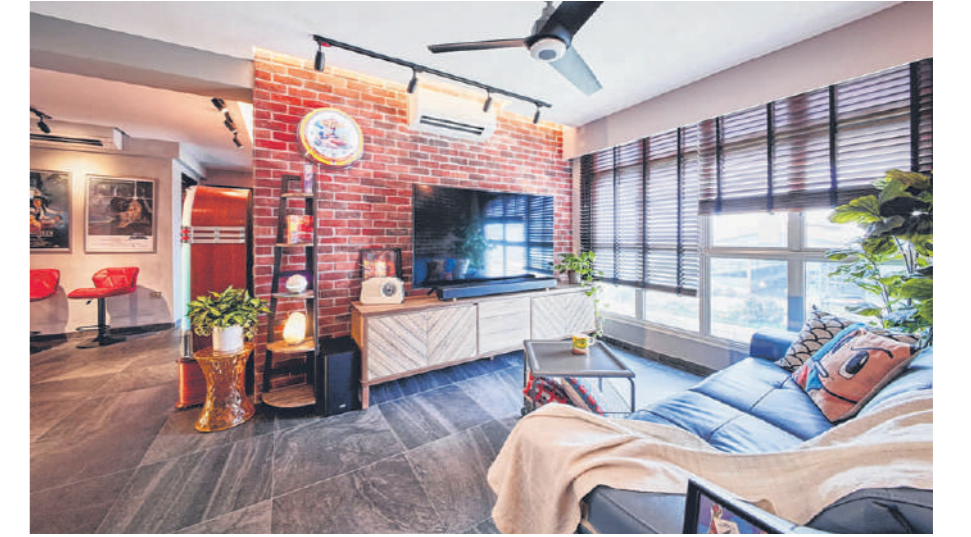
位于榜鹅的四房式组屋。屋主曾在美国居住过，喜欢当地餐馆的乡村风格，客厅设计因此走美式餐馆路线。红色瓷砖、复古点唱机、美式海报，有如美式餐馆Kenny Rogers的装潢。